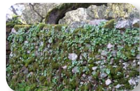
Los muros de piedra orientados al norte forman un auténtico ecosistema

Cumbres de Enmedio (el municipio más pequeño de Andalucía), está situado en una encrucijada de antiguos caminos. Después de visitar sus calles, con algunas casas señoriales, y su iglesia del siglo XVIII, pasaremos junto a la fuente abrevadero, donde podremos saciar nuestra sed y llenar nuestra cantimplora (aunque el agua de dicha fuente no está potabilizada). A la salida de la población, en dirección a Cumbres Mayores, veremos el panel de inicio de nuestro sendero al otro lado de la rotonda (ver [1] en el mapa).