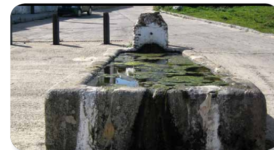
Las fuentes-abrevaderos servían para dar de beber a los rebaños que transitaban por estos caminos

Caminar por las callejas (caminos entre muros de piedra) de este sendero nos trasladará a tiempos lejanos, cuando eran utilizadas por los pastores en los desplazamientos con sus ganados. La fuente abrevadero existente en Cumbres de Enmedio da fe de ello y ha sido utilizada, durante décadas, para saciar la sed de los rebaños.