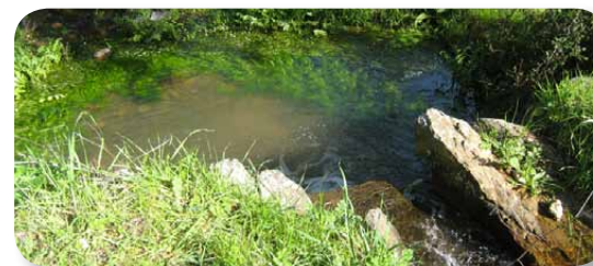
El barranco de la Magdalena es tributario del Arroyo del Sillo, que hace frontera con Extremadura

Estos se crían en régimen semiextensivo, pasando en las extensas fincas durante la mayor parte de año. Llegado el otoño, y a lo largo del periodo que se conoce como “montanera”, su principal fuente de alimentación son las bellotas producidas por el arbolado que aportan una calidad característica a sus carnes y derivados.