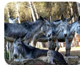
Las instalaciones de ADEBO albergan a numerosos burros

Continuaremos por el GR 7 hasta llegar a las inmediaciones de una de las instalaciones que la Asociación para la Defensa del Borrico [5] tiene en Rute. ADEBO tiene la finalidad de preservar las razas autóctonas del borrico andaluz, en serio peligro de extinción tras la sustitución de estos animales por máquinas en las labores agrícolas. Tras observar a estos simpáticos animales el itinerario se separa del trazado del GR 7, para subir y adentrarse de nuevo en el espeso pinar. Esta subida nos conducirá hasta las inmediaciones de la Torre del Canuto, una de las atalayas de vigilancia