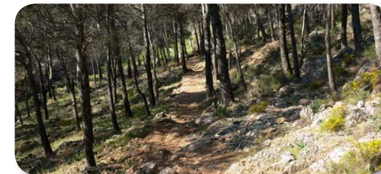
El sendero se adentra en el denso pinar

La última parte del recorrido discurre entre huertas de almendros hasta llegar a la carretera CO-3212, lugar donde finaliza la ruta. La jornada la podemos completar con una visita al pueblo de Rute, donde destacan sus museos del Anís, del Mantecado y del Jamón. En época invernal recibe la visita de cientos de turistas para visitar las esculturas de chocolate.