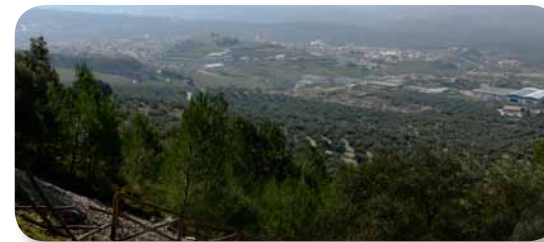
El pueblo de Rute visto desde el Pinar de Rute

cuya cima se alza el Santuario de Nuestra Señora de Araceli, patrona de Lucena y del Campo Andaluz. Desde este punto también se divisan algunas sierras malagueñas, como la Sierra del Torcal de Antequera.