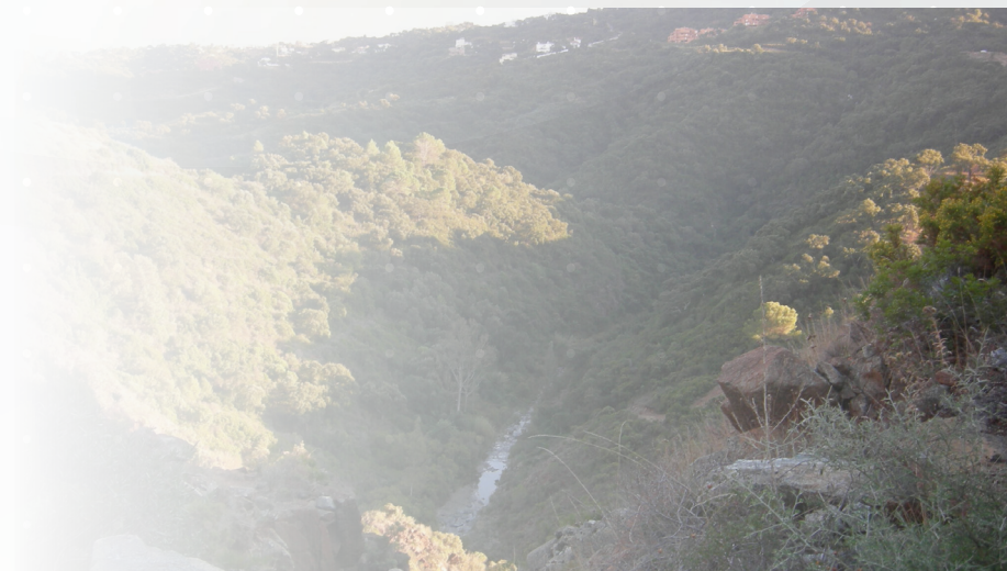
Río Ojen (ZEC Río Fuengirola). Autores: D. Cabello, T. de Diego, M.C. Martín y M.I. Cerrillo