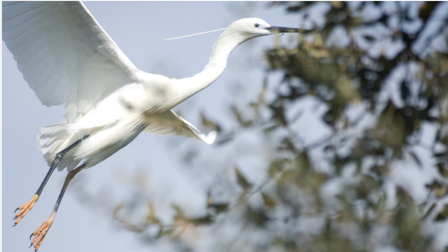
Garceta común ( Egretta garzetta ).