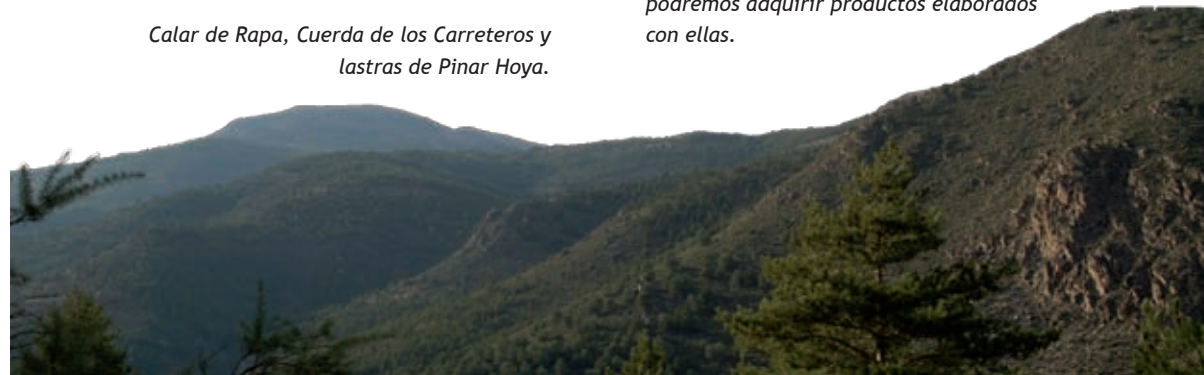
Calar de Rapa, Cuerda de los Carreteros y lastras de Pinar Hoya.

Es aquí, después de haber recorrido quinientos metros, donde comienza la señalización del sendero Floranes-Cortijo del Tío Capote, con un primer panel que nos dirige hacia el frente por un acusado descenso, y dejando a nuestra izquierda el sendero Floranes-Arredondo.