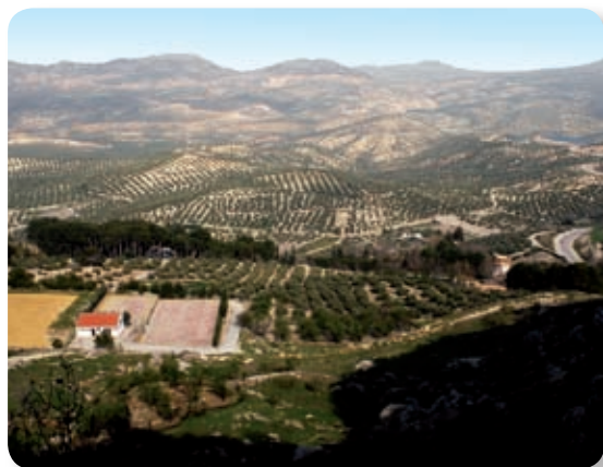
La subida a la cueva nos permite observar una amplia extensión de un paisaje en transición entre la campiña olivarera y la sierra.

Para iniciar el camino nos situamos en la ermita de Cánava, a las afueras de la población de Jimena. Desde aquí, subiremos por detrás de la piscina municipal hasta llegar a un cruce que, a la izquierda, conduce a las pistas polideportivas, donde comienza el recorrido (ver [1] en el mapa).