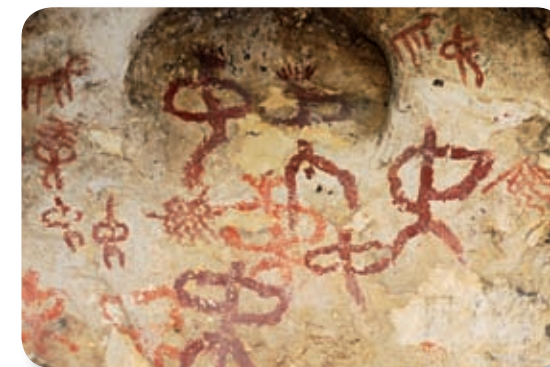
Un oculado es una especie de ojo divino, posiblemente relacionado con el más allá y con los antepasados.

Las pinturas que vemos en el interior son bastante abstractas, de trazos relativamente gruesos. Posiblemente hechos con los propios dedos, o con una ramita machacada a manera de rústico pincel. Aparecen varias representaciones: figuras zoomorfas y antropomorfas. Algunas de las figuras humanas están acompañadas de adornos como plumas, cuernos, armas u otros objetos. Llama poderosamente la atención la figura de un oculado, con tentáculos y rodeado por figuras humanas con los brazos en asa. Otras pinturas representativas son las de dos figuras juntas y la de un individuo que parece dar de comer a un animal. Si queremos visitar el interior de la cueva, tendremos que dirigirnos al Ayuntamiento de Jimena.