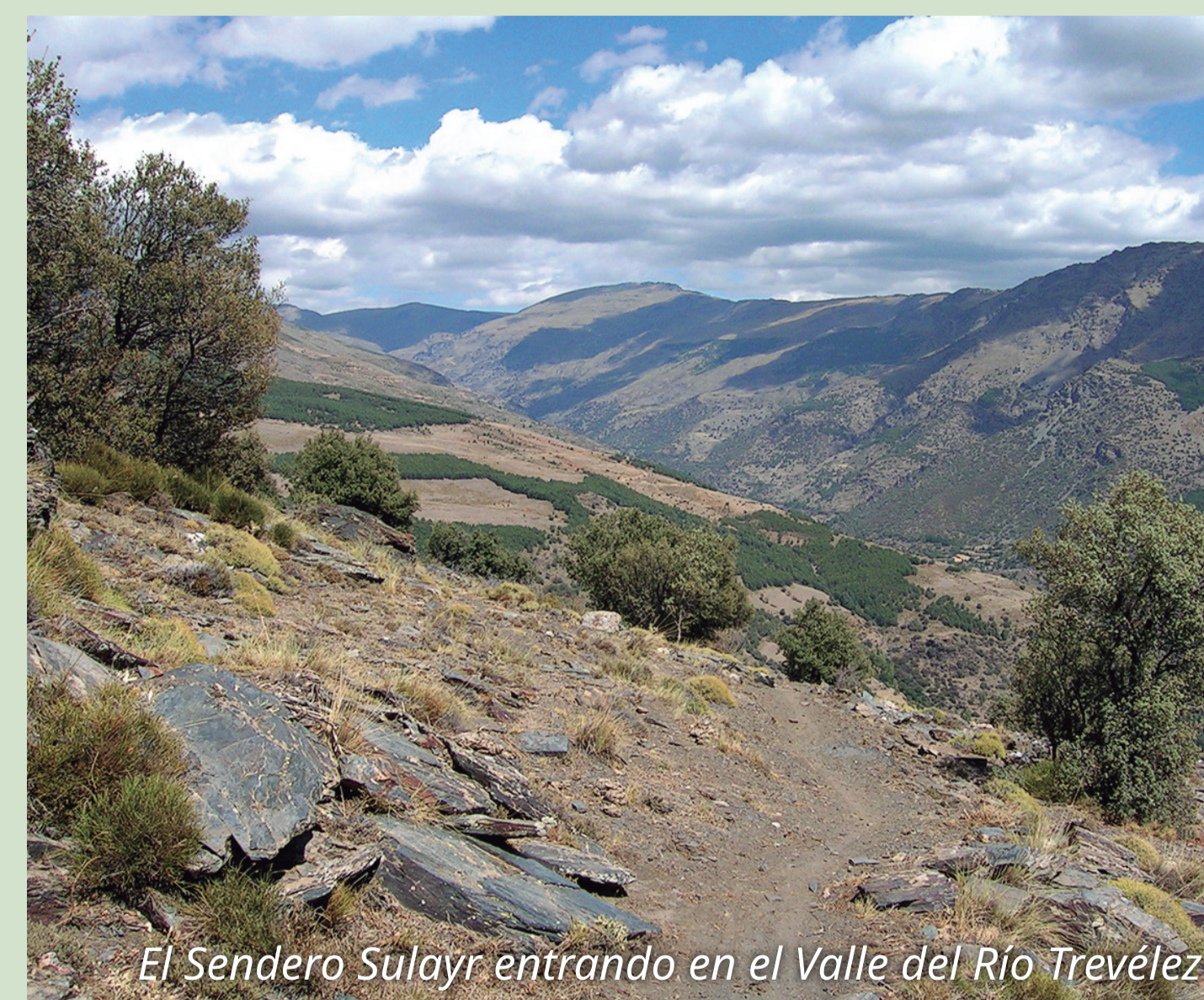
El Sendero Sulayr entrando en el Valle del Rio Trevélez

SIERRA NEVADA PARQUE NACIONAL PARQUE NATURAL