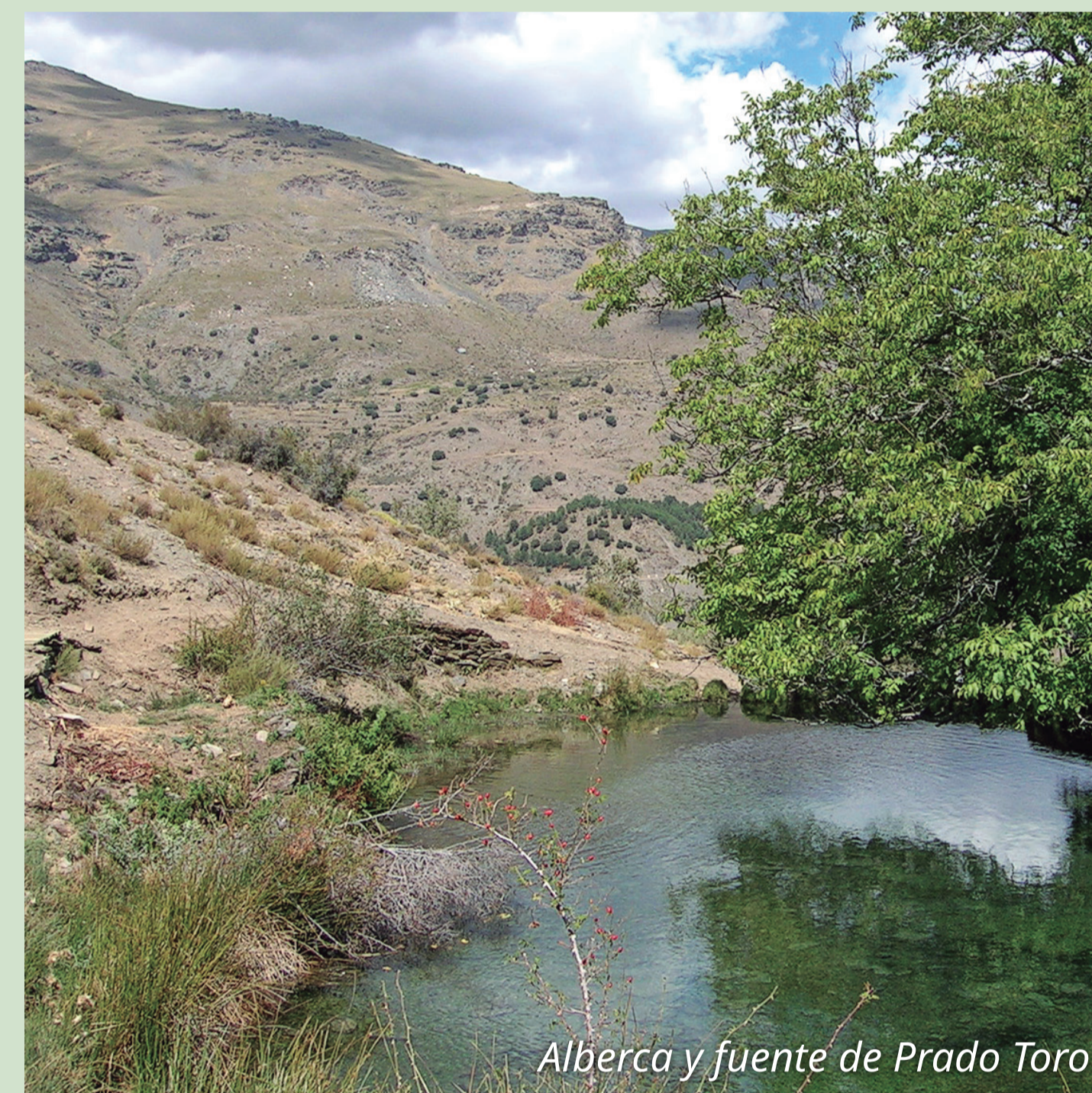
Alberca y fuente de Prado Toro