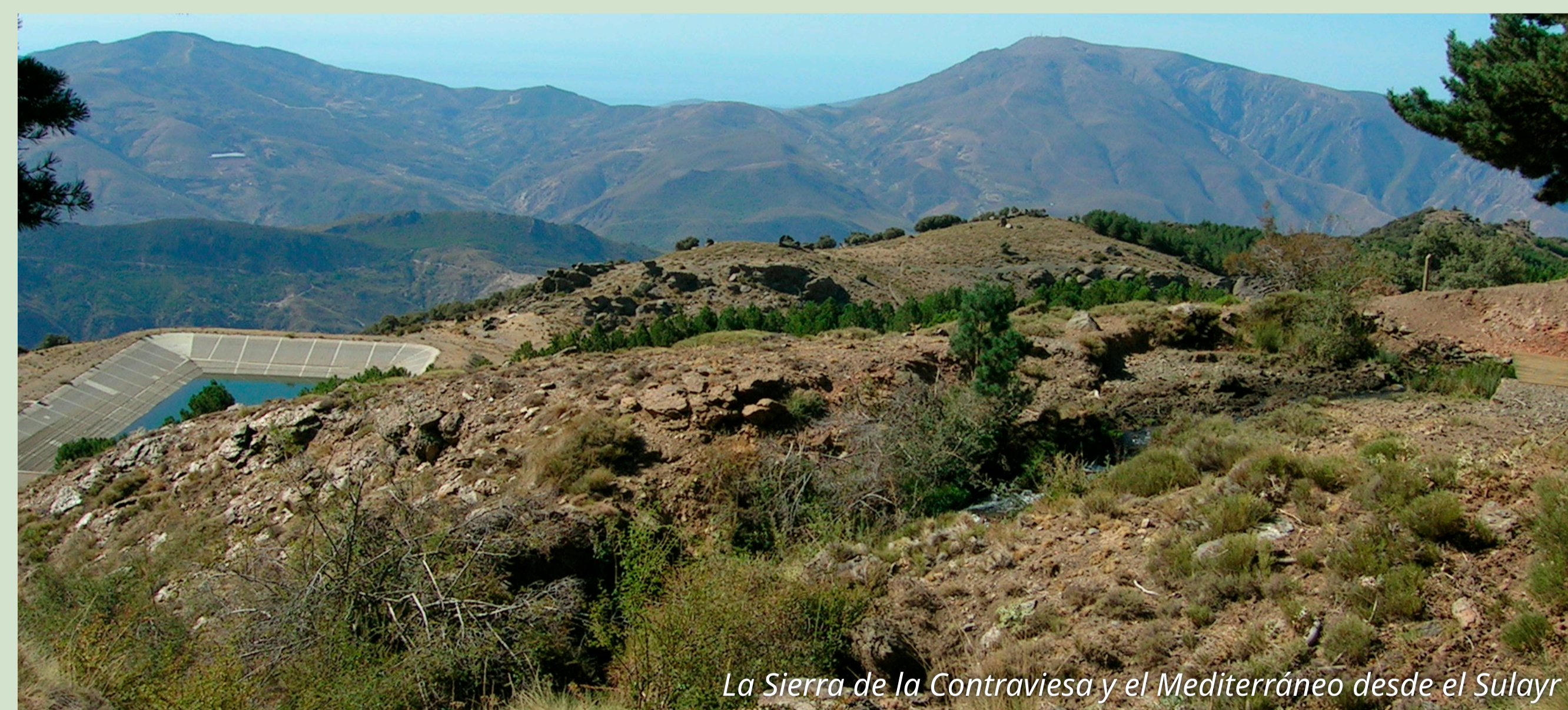
La Sierra de la Contravesa y el Mediterráneo desde el Sulayr

En este tramo 6 del sendero, que transcurre entre Capileira y Trevélez, disfrutaremos de interesantes vistas, tanto de las cumbres de la sierra como del horizonte marino. Este recorrido panorámico, con fuertes pendientes, atraviesa paisajes atractivos donde el pinar alterna con pequeños bosquetes de encina y roble, poblados por una diversa fauna, donde destaca la cabra montés y el jabalí. A lo largo del trayecto encontraremos numerosos elementos de la cultura tradicional de la Alpujarra, como son las acequias, cortijos, balsas, apriscos, etc. que nos ilustran sobre la vida en este agreste territorio.