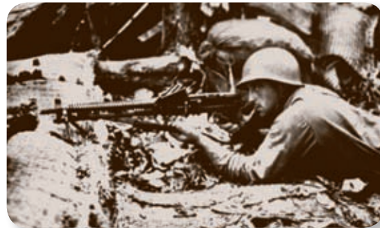
Para muchos el nombre de Guadalcanal está asociado a una de las Islas Salomón donde tuvo lugar una de las principales batallas de la II Guerra Mundial. No se trata de una coincidencia. El nombre de la isla fue puesto en el siglo XVI por el explorador Pedro de Ortega Valencia, que era natural de esta localidad sevillana.

Junto a la carretera con dirección a Fuente del Arco y Llerena (A-433), en un lugar cercano a la ermita del Cristo, que se encuentra al otro lado de la carretera y de la vía del tren, hay un descansadero del que parte una antigua vía pecuaria, el cordel de los Molinos, por la que iniciamos nuestra ruta por la sierra del Viento (ver [1] en el mapa), cuyo nombre nos pone en guardia ante un fenómeno meteorológico al que muy probablemente tengamos que hacer frente.