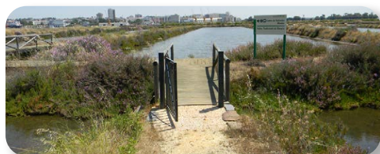
Las salinas tradicionales de Bacuta, abandonadas hace décadas, han sido puestas en valor recientemente para su uso interpretativo

cos alimentándose. Al poco llegamos al puente sobre el Caño de la Calatilla, que divide en dos la isla de Bacuta [2], lo cruzaremos disfrutando de las vistas que nos ofrece de la ciudad de Huelva y su puerto. Un poco más adelante el camino gira a la izquierda, adentrándose en las salinas por una pequeña pasarela de madera [3], hasta situarnos en uno de los muros que delimitan las naves de los cristalizadores.