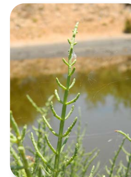
Las plantas que viven en estos humedales salinos están perfectamente adaptadas a este medio tan hostil. Unas expulsan la sal a través de sus hojas, otras, sencillamente, impiden la entrada de sal en sus células

En este paseo por las salinas tradicionales de Bacuta, veremos como la mano del hombre no sólo no ha afectado negativamente al entorno natural, sino que incluso ha favorecido a algunas de las especies que viven en estas marismas. El uso de energías renovables como el sol, el viento y la fuerza de las mareas, acompañados por el trabajo del hombre, hacen que el impacto medioambiental sea mínimo. Muchas zancudas, aprovechando las aguas someras de los estanques, los utilizan para alimentarse y sus muros como dormitorios.