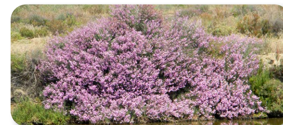
Esta planta podemos considerarla como “la alegría de las marismas”, su espectacular floración llena de color la monotonía cromática de estos ecosistemas

Al final de este muro llegamos a una explanada, donde se encuentra ubicada una cabaña [6], que sirve de aula de interpretación de las salinas tradicionales. En esta explanada se amontona la sal extraída para su transporte. Continuamos nuestro sendero tomando un muro que va paralelo al que traíamos, pero un poco más bajo. De nuevo volvemos a estar rodeados de la típica vegetación de marisma. Poco antes del final de este muro, retomamos el camino de ida para regresar al punto de inicio y dar por concluido nuestro itinerario. Al salir a la carretera, podemos acercarnos hasta el observatorio ornitológico, que se encuentra al final del camino que queda al otro lado de la calzada.