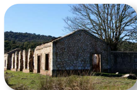
Esta construcción era el antiguo taller de las locomotoras. Detrás, podemos ver una gran elevación: son escombreras de la mina

El principio (ver [1] en el mapa) y al final de este sendero discurren por el antiguo trazado del ferrocarril que llevaba el mineral de la mina del Cerro del Hierro hasta el puerto de Sevilla, donde se embarcaba para llevarlo a Escocia. Junto a este trazado, hoy recuperado para su uso turístico y deportivo como Vía Verde, se conservan restos de las antiguas construcciones de la mina y del ferrocarril: almacenes, talleres, cargaderos, puentes y el poblado mismo del Cerro del Hierro, donde vivían las familias de los trabajadores de la mina.