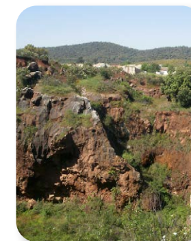
El poblado del Cerro del Hierro se construyó a las afueras de la mina para alojar a las familias de los mineros. Al avanzar la mina, siguiendo los filones, la mina llegó hasta el poblado, e incluso se demolieron casas para extraer el mineral sobre el que se asentaban

Avanzando en nuestro camino y ya cerca del poblado del Cerro del Hierro, entramos en un paisaje distinto [5]. El bosque adehesado da paso a un terrero con afloramientos de roca caliza, escombros y suelo erosionado. Estamos muy cerca de la antigua mina, donde la actividad extractiva ha descubierto y modelado un paisaje espectacular que ha merecido ser catalogado como Monumento Natural.