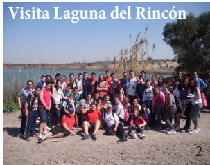
Visita Laguna del Rincón

La laguna tiene una superficie máxima de inundación de 9 hectáreas, y se alimenta principalmente de agua de precipitación directa, aunque también de escorrentía de su cuenca vertiente y de aguas subterráneas. Tiene por tanto un carácter endorreico. Su desagüe natural es el arroyo de la Camarata y de la Capellanía. Las aguas de la laguna y del Rincón son moderadamente salinas y presentan una estratificación de la temperatura y oxígeno en profundidad durante los periodos más cálidos; mientras que en otoño e invierno existe una mezcla de las capas, favoreciendo la disponibilidad de nutrientes. En el pasado la laguna del Rincón sufrió varios intentos de desecación, primero desde 1886 por ser considerada "zona insalubre por paludismo" y después en base a la "Ley de desecación y saneamiento de lagunas, marismas y terrenos pantanosos" de 1918 (conocida como Ley Cambó) y a la Ley de colonización de grandes zonas regables de 1939.