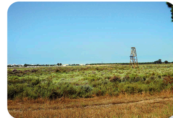
Vistas de las marismas con estructura para nido de águila pescadora

Continuaremos nuestro sendero, siempre por el borde del pinar, hasta el final del gancho arenoso [4], allí donde se asoma a la marisma, y desde donde podremos divisar, un poco en la lejanía, la localidad de Punta Umbría y el ir y venir de los barcos por su ría.