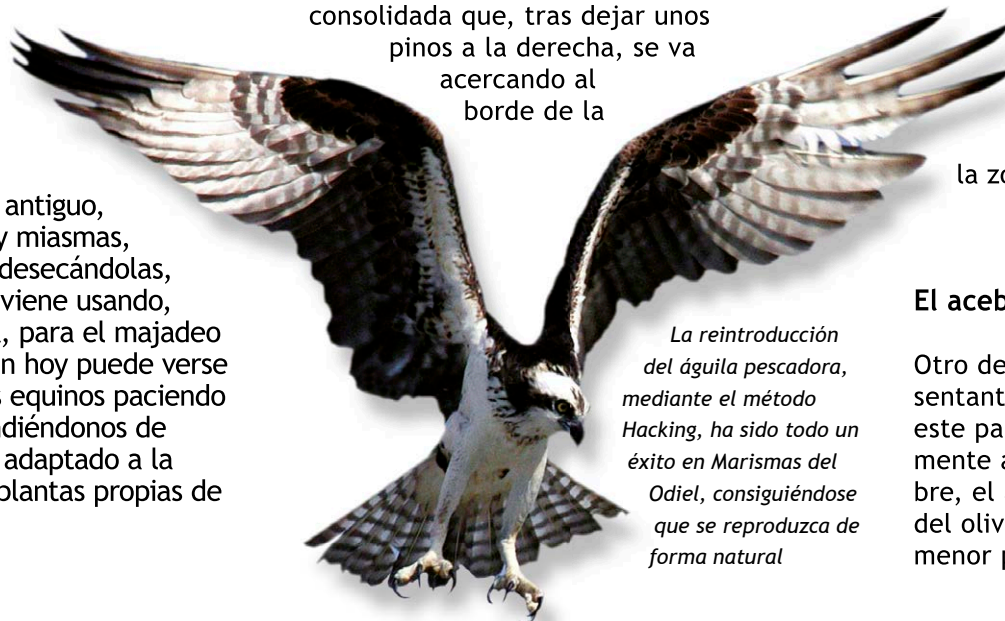
La reintroducción del águila pescadora, mediante el método Hacking, ha sido todo un éxito en Marismas del Odiel, consiguiéndose que se reproduzca de forma natural

La mano del hombre siempre ha estado presente en la isla de Saltés, aprovechando, de una manera u otra, los recursos que este espacio ofrece. Aunque las marismas se han considerado, desde antiguo, como fuente de plagas y miasmas, que debían erradicarse desecándolas, este gancho arenoso se viene usando, desde los años cuarenta, para el majadeo de caballos y ovejas. Aún hoy puede verse alguna manada de estos equinos paciendo por la marisma, sorprendiéndonos de como este animal se ha adaptado a la alimentación con estas plantas propias de tierras salobres.