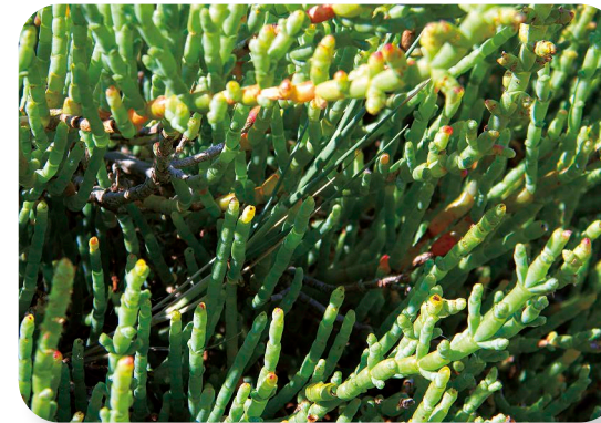
Alacranera ( astrocneum macrostachyum )

marisma, donde iremos observando una amplia muestra de vegetación halófila [2]. Estas plantas utilizan varios mecanismos para poder sobrevivir en este medio tan salino, como por ejemplo excretando la sal sobrante. Salicornias, alacraneras o la espartina marítima son claros exponentes de esta característica.