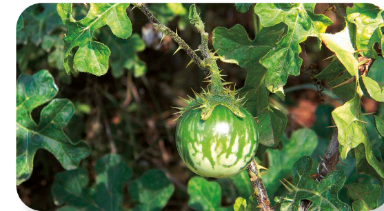
La introducción de especies foráneas hace peligrar a las autóctonas, a las que desplaza de su habitat

Pero no todas las especies que encontramos son autóctonas, también existen algunas foráneas, como el tomatito del diablo, originaria del sur de África. Esta curiosa planta tiene muchas espinas, además de ser bastante tóxica.