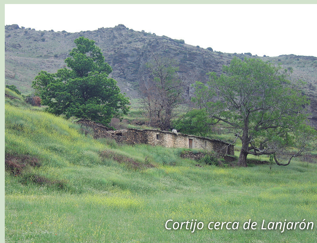
Cortijo cerca de Lanjarón

Este gran itinerario panorámico recorre la media y alta montaña, atravesando lomas y barrancos, bosques, prados y piornales, con una flora y fauna muy diversa. También encontramos antiguos cortijos, banales, acequias, balsas, apriscos... que han contribuido a la formación del paisaje igualmente único de Sierra Nevada.