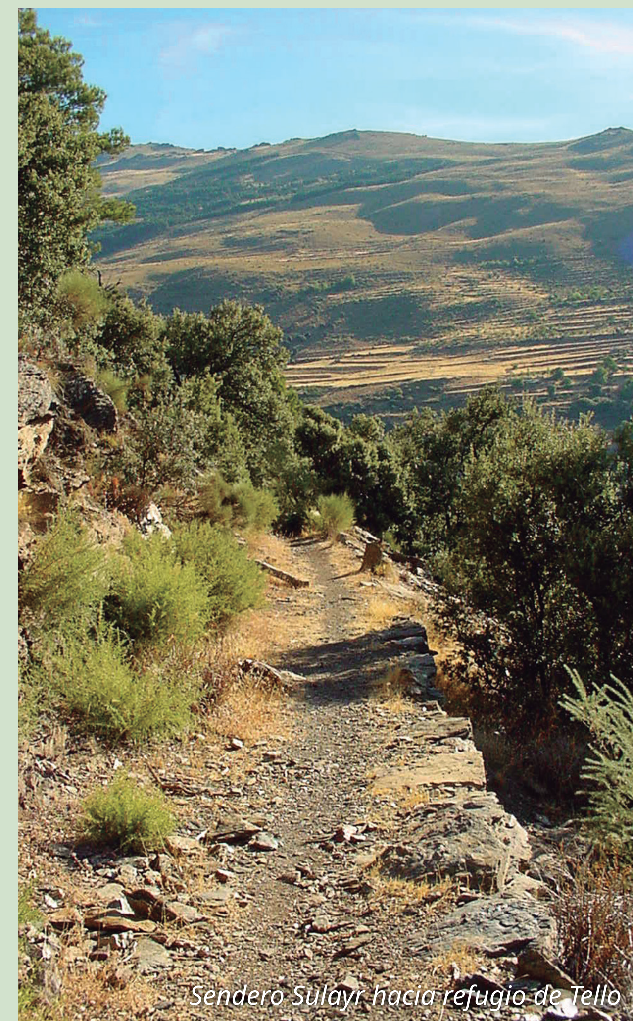
Sendero Sulayr hacia refugio de Tello

Acceso en vehículo y a pie: una pista cementada sube en dirección a Tello desde la propia carretera A-348 a la entrada oeste del pueblo, entre un restaurante y las instalaciones del balneario.