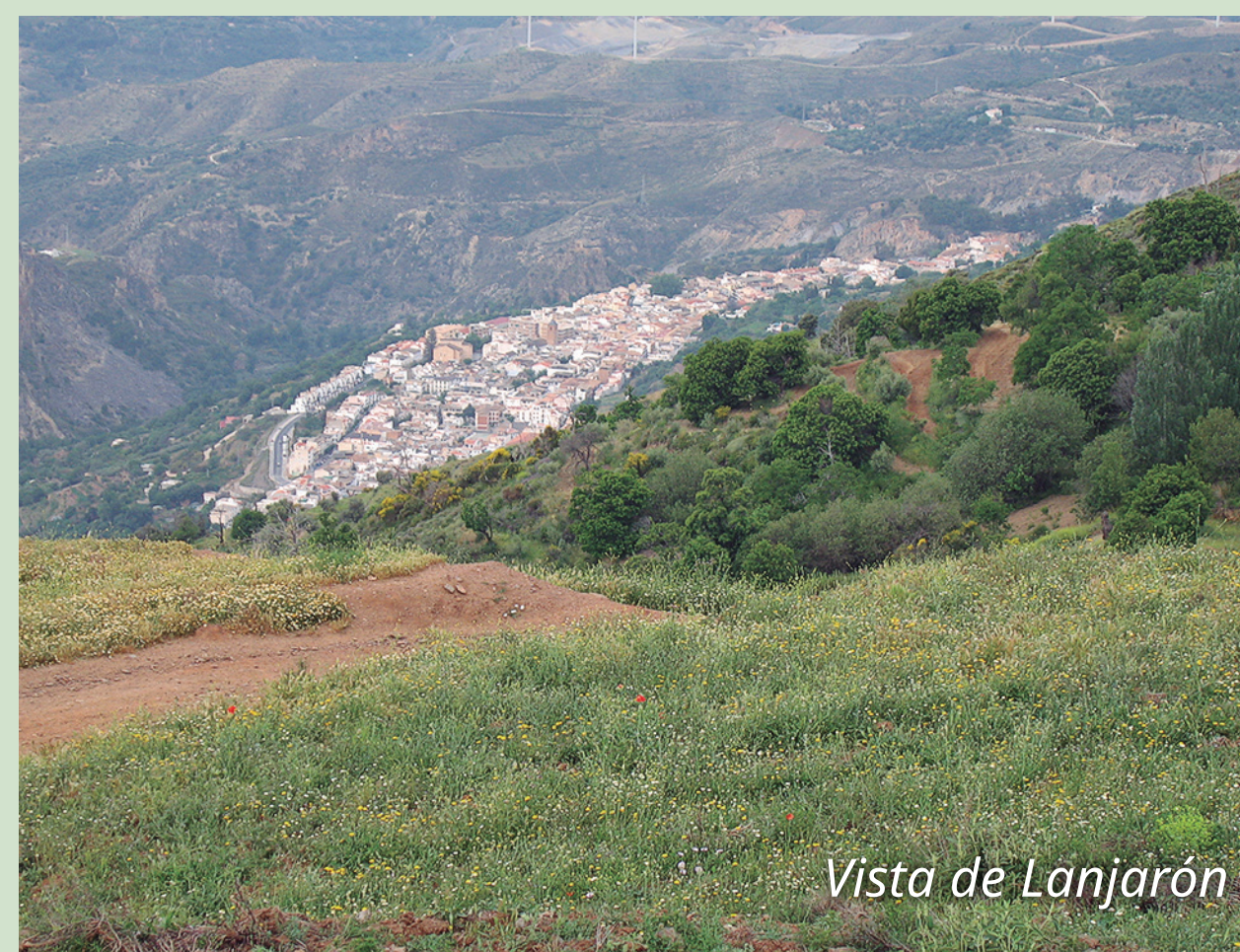
Vista de Lanjarón