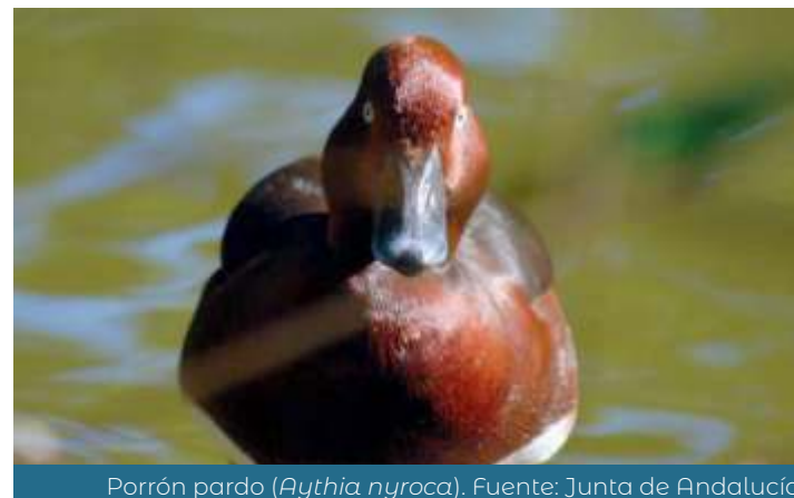
Porrón pardo ( Aythya nyroca ).