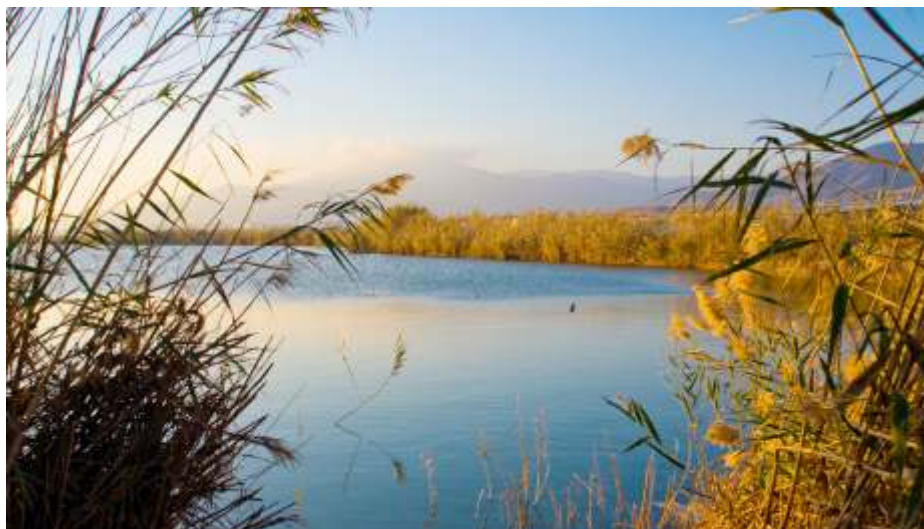
Laguna Albufera Nueva. Autor: Fernando Ortega González