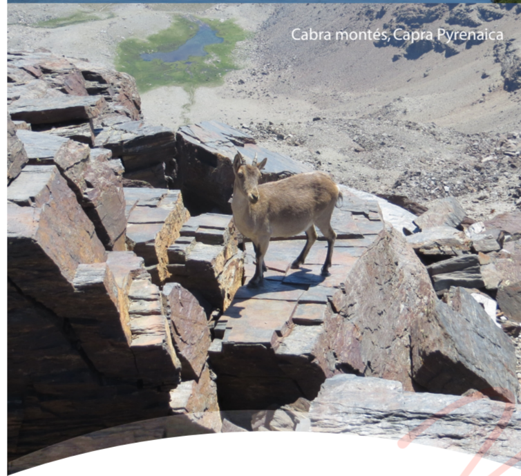
Cabra montés, Capra Pyrenaica