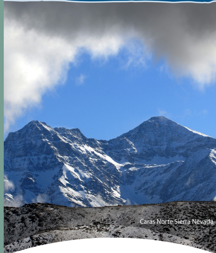
Caras Norte Sierra Nevada