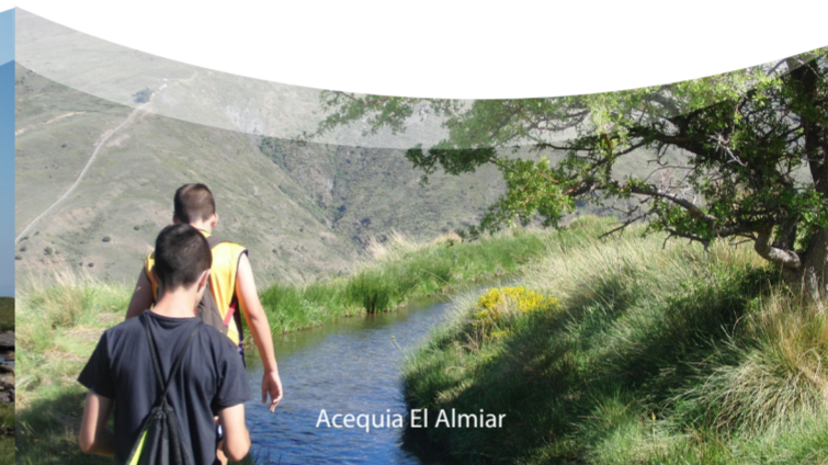
Acequia El Almiar