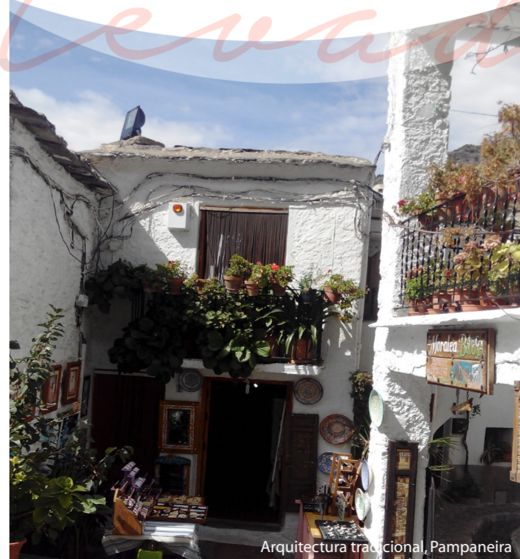
Arquitectura tradicional, Pampaneira

Una cultura milenaria. La relación del hombre con Sierra Nevada se remonta a miles de años. Asentamientos neolíticos, restos de las culturas de los metales, junto con el paso de fenicios, cartagineses, romanos, visigodos y árabes, conforman un enorme legado histórico. Sierra Nevada ha sido históricamente lugar de asentamiento y frontera de diferentes culturas, refugio de costumbres y tradiciones serranas. La "mano del hombre" ha configurado un paisaje ecocultural de enorme valor y atractivo basado en una armoniosa relación con su entorno y un aprovechamiento sostenible de los recursos naturales. Usos y actividades tradicionales, técnicas metalúrgicas, agrícolas, ganaderas, arquitectónicas e hidráulicas, han generado vínculos, infinitamente ricos, entre el hombre y la naturaleza.