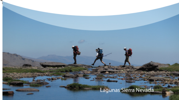
Lagunas Sierra Nevada

En Sierra Nevada se encuentra el Pico del Mulhacén (que toma el nombre del penúltimo rey musulmán), techo de la península ibérica con sus 3.479 m, que está acompañado de una veintena más de cimas que superan los 3.000 m desde el Caballo, el situado más al sur y al oeste hasta el Picón de Jérez, el tresmil más al norte y oriental.