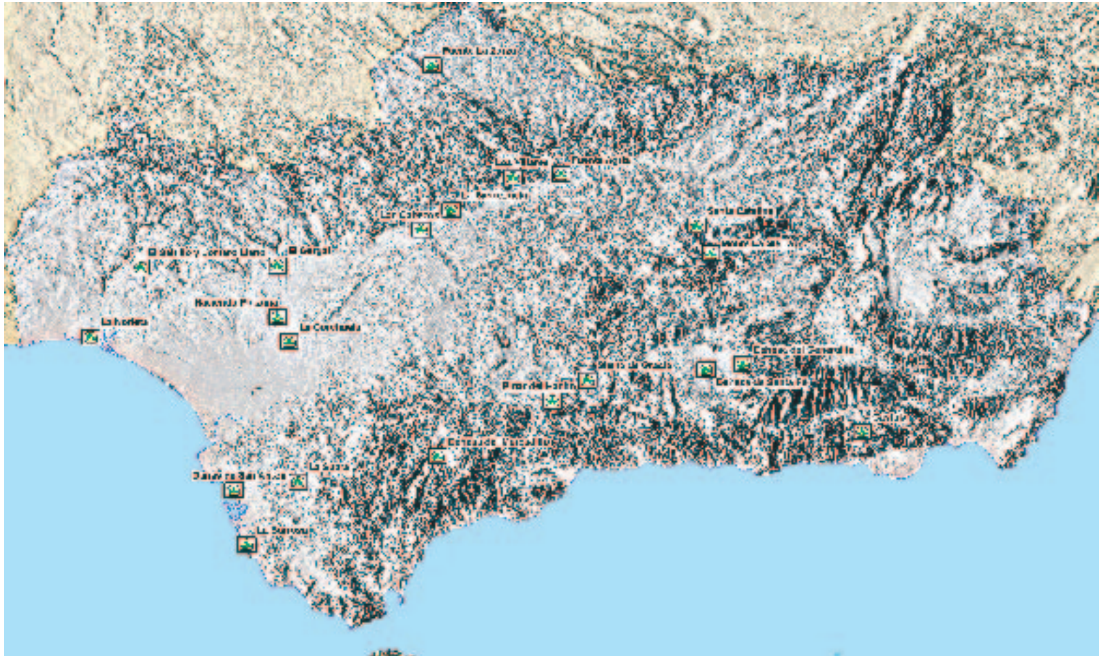
Parques Periurbanos de Andalucía