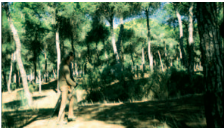
Dunas de San Antón, Cádiz