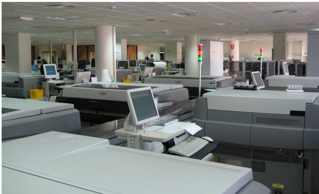
1: Área de automatización

Las actuales instalaciones del laboratorio de análisis constan de una amplia superficie diáfana de unos 500m 2 , situada en la planta baja del hospital, sobre la zona de urgencias, donde se sitúa el área de automatización, y a la que se accede por el pasillo de cafetería, y de una serie de pequeños laboratorios satélites de técnicas especiales. Además, hay un laboratorio de urgencias en el otro edificio (Hospital Provincial), donde también está ubicada la toma de muestras principal. Los laboratorios satélite son el de citogenética, el de genética molecular y el de técnicas manuales, todos ellos adyacentes al principal, y el de reproducción asistida, adyacente a las consultas de fertilidad del edificio materno-infantil. El laboratorio cuenta, además, con un área de urgencias, una zona de recepción y distribución, una unidad administrativa, un almacén con una sala refrigerada de 15m 2 y una habitación de -20°C de 4m 2 , una sala de congeladores y una sala de reuniones. También hay despachos para el Jefe de Servicio, facultativos, unidad de calidad, supervisión de enfermería e informática, así como 2 dormitorios para facultativos de guardia.