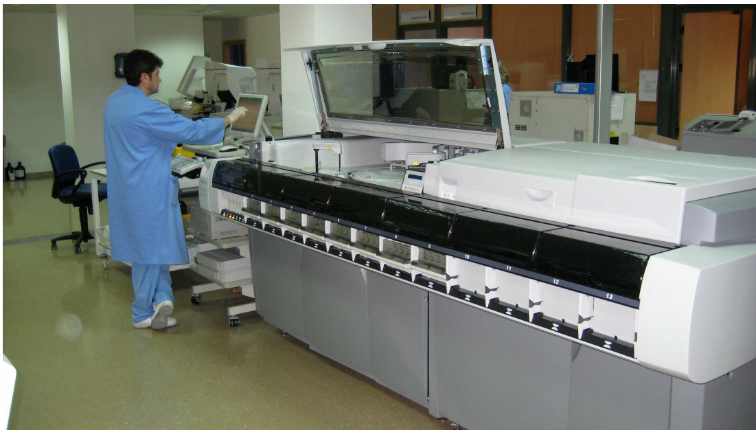
2: detalle de la zona de urgencias

Adyacente a la zona de automatización hay también un estar de personal técnico y una pequeña habitación frigorífica de 4m 2 .