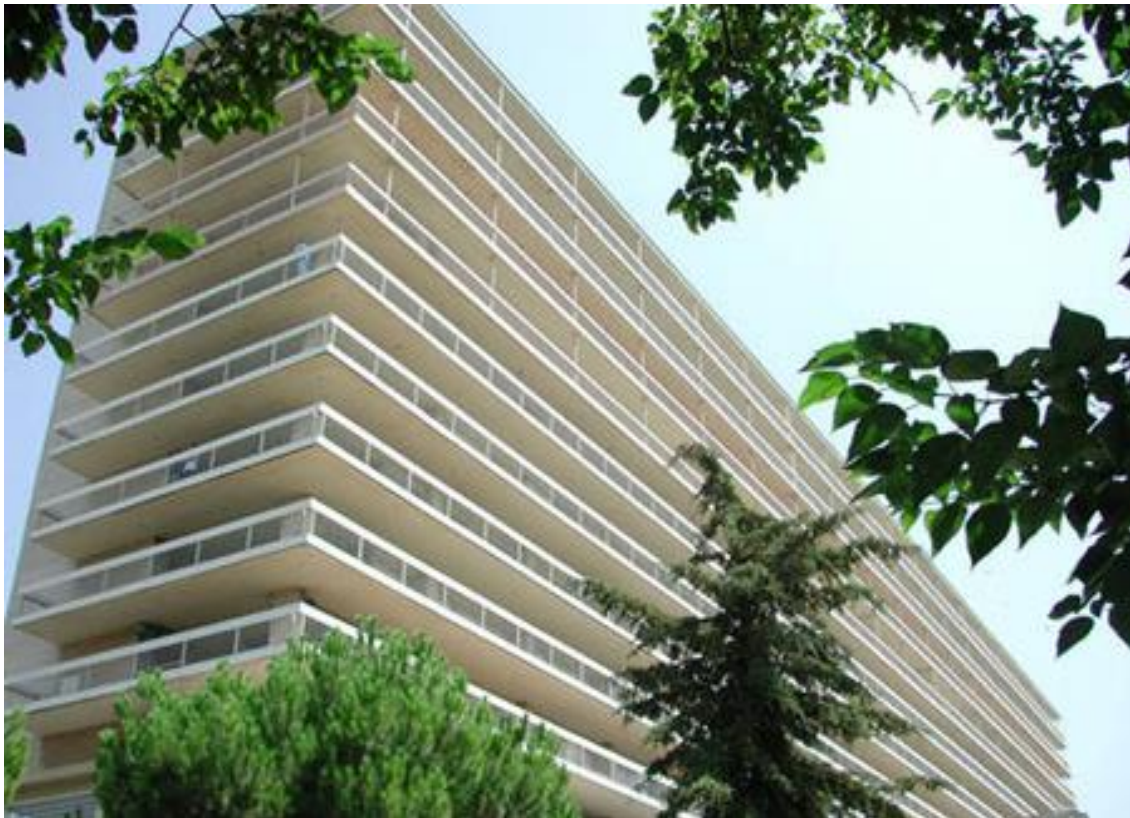
Hospital Provincial. Avda. Menendez Pidal s/n 14004 Córdoba Tlf 957 011 446