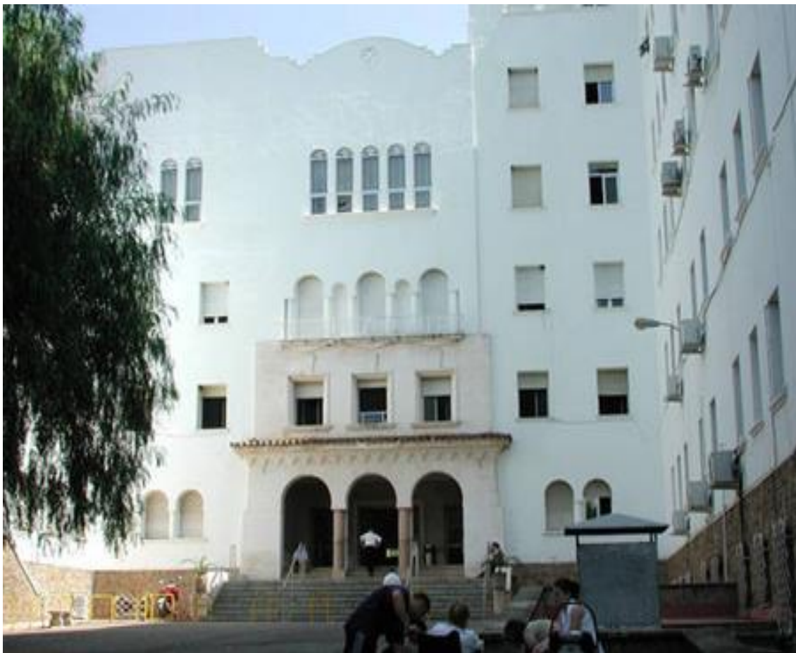
Hospital Los Morales. Carretera Los Morales s/n 14012 Córdoba Tlf. 957 012 042