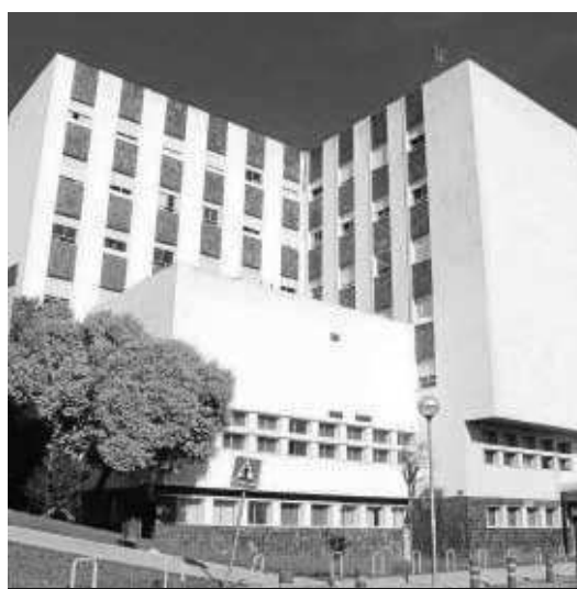
Fachada principal del Hospital Reina Sofía.

nal de trasplantes de la Asociación Española de Cirujanos o la presentación de una aplicación de oncología. Otra de las actividades, que se desarrollará los últimos días de febrero, es la Semana de la Hematología, que permitirá organizar encuentros con profesionales, pacientes y colectivos de pacientes vinculados a la especialidad. Cursos de actualización y sobre controversias en distintas patologías completan este bloque científico, al que hay que sumar encuentros en el área de la enfermería. También se incluyen jornadas de investigación, cursos de resucitación cardiopulmonar, en curso con cuidadoras y actividades formativas por parte de la dirección de Enfermería. Todos estos forman parte de la programación de actos científicos -para los que hay previstos una treintena-, mientras que los de carácter social y cultural incluyen desde la presentación del