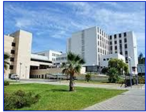
HOSPITAL UNIVERSITARIO REINA SOFIA