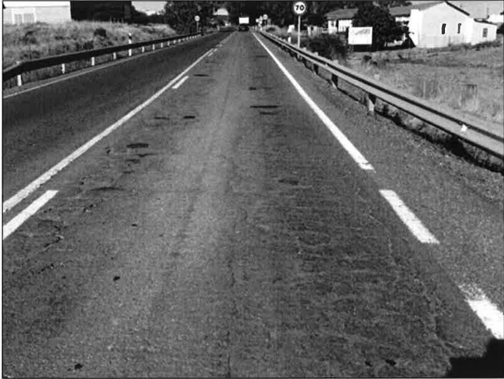
A-493 p.k. 31+700