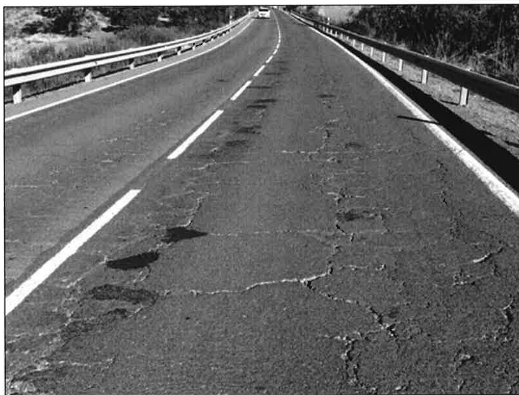
A-493 p.k. 30+300