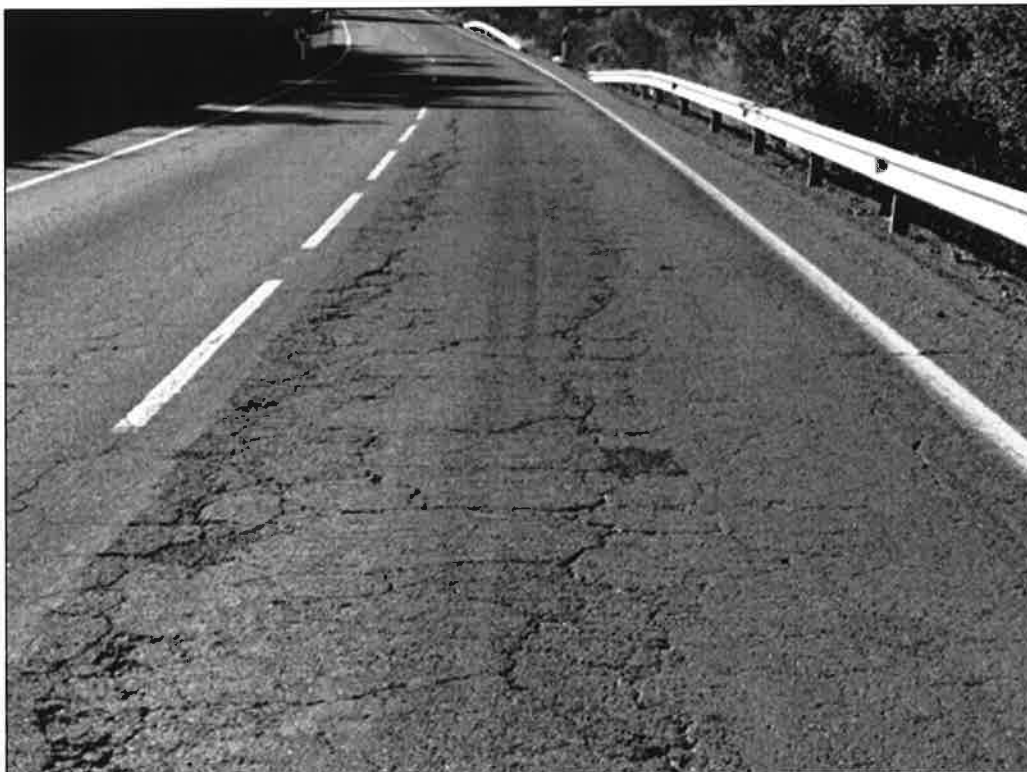
A-493 p.k. 28+500