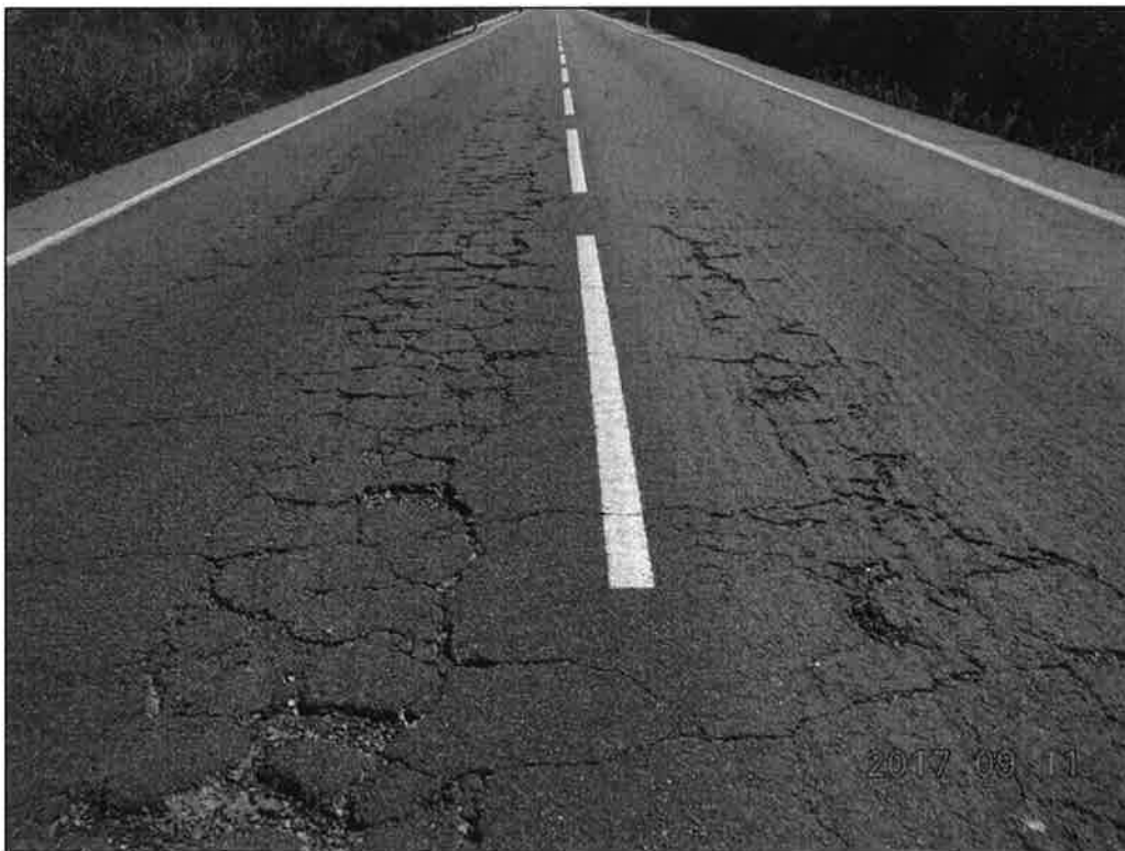
A-493 p.k. 27+000

La zona de actuación se sitúa entre los puntos kilométricos 27+000 y 32+050 aproximadamente de la carretera A-493 (llegada a la localidad de Valverde del Camino). El firme presenta un estado muy deteriorado, con abundantes fisuras, cuarteos y piel de cocodrilo en la capa de rodadura y bacheos generalizados. La regularidad superficial presenta unos niveles muy por debajo de los necesarios para garantizar la seguridad vial.