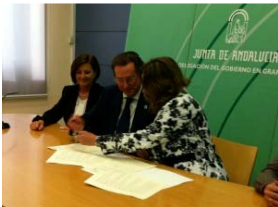
Firma del convenio de colaboración entre la Fundación Mediara y la Asociación Amefa

En mediación comunitaria el servicio se implantará en Granada.