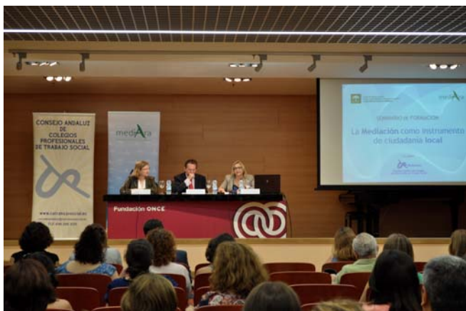
Emilio de Llera, consejero de Justicia e Interior durante la presentación del Seminario

La Fundación Mediara ha realizado en las ocho provincias andaluzas el seminario formativo "La Mediación como instrumento de ciudadanía local", en colaboración con el Consejo Andaluz de Colegios de Diplomados en Trabajo Social. Durante los meses de abril a junio, Fundación Mediara ha formado a casi 900 personas inscritas en toda Andalucía. El seminario, con la misma estructura para todas las sesiones, constaba de una parte teóri-