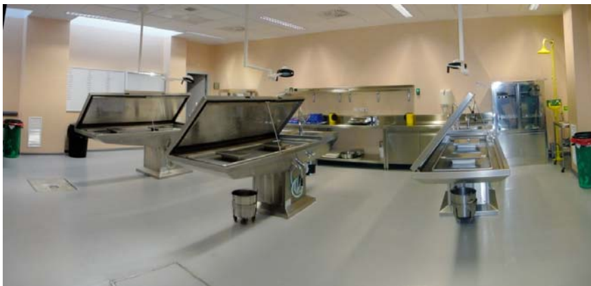
Dependencias del Servicio de Patología IML de Sevilla

A pesar de las deficiencias de aquella situación, el cambio que suponía la nueva organización, y fundamentalmente la centralización del trabajo en los IML, no parecía tarea fácil y, de hecho, fuera de nuestra Comunidad, aún después de transcurridos años desde la entrada en funcionamiento teórica, algunos IML, en la práctica, siguen desarrollando su trabajo de acuerdo al modelo antiguo. No fue así en los IML Andalucía, en los que desde el primer momento tras su puesta en marcha se produjo en todas las provincias la centralización de la actividad, separándose los Servicios de Clínica y Patología, principal razón de ser de los IML.