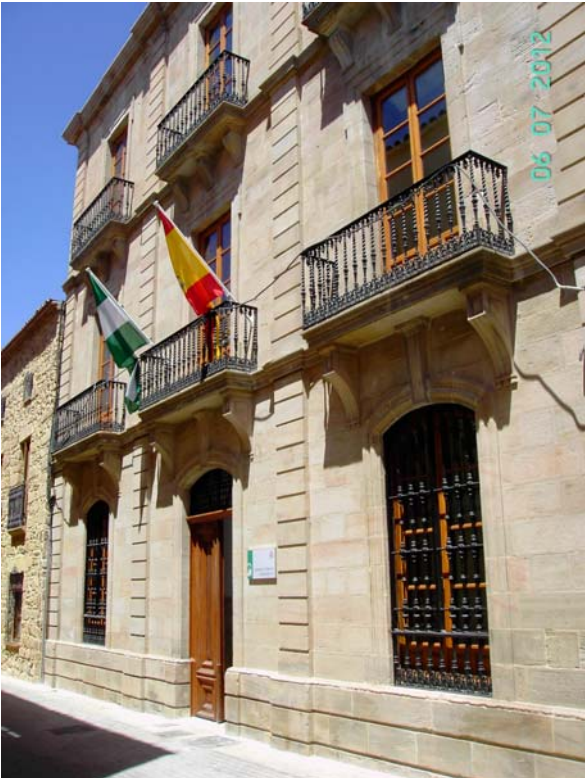
Fachada de la nueva sede judicial de Linares

Con la publicación del Real Decreto 819/2010, de 25 de junio, el Ministerio de Justicia aprobaba la creación en el Partido Judicial de Linares de un Juzgado Mixto, el número 5, estando prevista su entrada en funcionamiento para el pasado 30 de junio de 2011. A pesar de las dificultades presupuestarias existentes para su puesta en funcionamiento, la Junta de Andalucía, a diferencia de otras comunidades, mantuvo su compromiso con la creación de este nuevo órgano judicial tan reclamado por la ciudad de Linares, el TSJA en sus diferentes Memorias y, en general, por los profesionales del Derecho. Este compromiso conllevó la