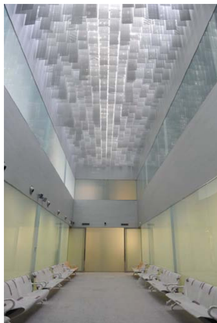
Sala de espera IML de Granada

Muy importante también para el avance de la medicina forense es el Protocolo General de colaboración suscrito con la Consejería de Salud y Bienestar Social, en cuyo marco se está trabajando en la actualidad en varias propuestas, siendo de especial relevancia la que hace referencia a las actividades formativas para los médicos forenses de los IML de Andalucía, cuyo objetivo es la actualización de conocimientos teóricos y prácticos, profundizando fundamentalmente en lo referente a los nuevos instrumentos, métodos, técnicas de diagnóstico y tratamientos desarrollados por los distintos Servicios en relación con las materias de interés que contribuyan a una mayor calidad de la actividad pericial médico forense. Esta formación continuada constituye un primer paso en la necesaria especiali-