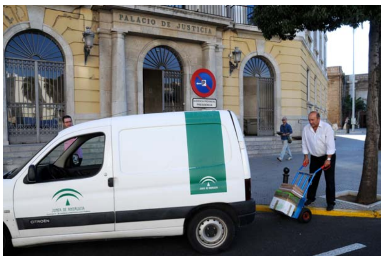
Audiencia Provincial de Cádiz

Con este nuevo sistema se puede llegar a conseguir un importante ahorro