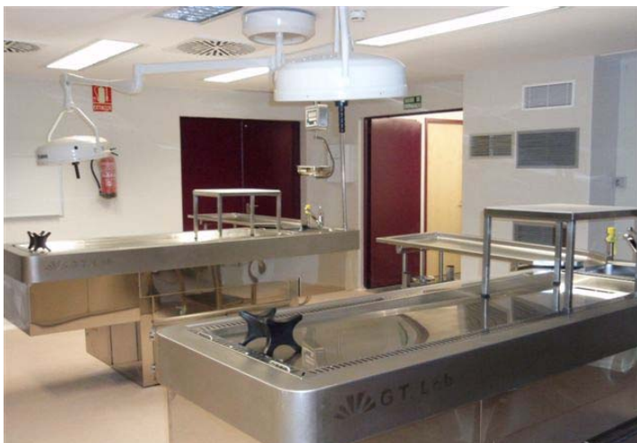
Sala de autopsias del IML de Almería

nero, Andalucía fue pionera en la creación y puesta en marcha, dentro de los IML, de las Unidades de Valoración Integral de Violencia de Género (UVIVG), unidades multidisciplinarias de actuación especializada para la valoración de la violencia desde una perspectiva integral: valoración de la mujer, del denunciado y, en su caso, de los menores expuestos a la violencia, y todo ello con el objetivo último de proteger a la mujer víctima de violencia de género. Además, la valoración integral de cada situación de violencia en particular permite profundizar en el conocimiento de la violencia de género, lo que hace posible trabajar en la prevención social.