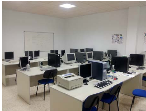
Aula de Informática

El centro de Día Hacam cuenta con una plantilla de profesionales formados en materia de justicia juvenil, adaptados a los