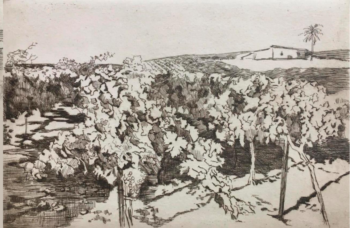
Imagen: grabado "Viñas" Carmen Chofre

Inscripción: Información y reservas: Teléfono y whatsapp 639,51,23,50 Correo elect: amigosarchivojerez@gmail.com Blog: https://amigosarchivojerez.com/