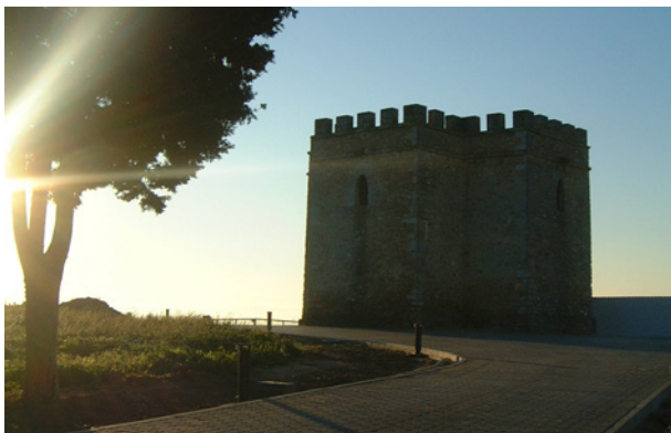
Turm von Doña Blanca

Es handelt sich um ein kleines Bauwerk mit einem Grundriss in Form eines griechischen Kreuzes, das gegen Ende des 15. Jh. als herausragende Anhöhe über der Bucht und dem Unterlauf des Flusse Guadalete erbaut wurde. Der heutige Zustand ist das Ergebnis einer Rekonstruktion. Diese wurde in der zweiten Hälfte