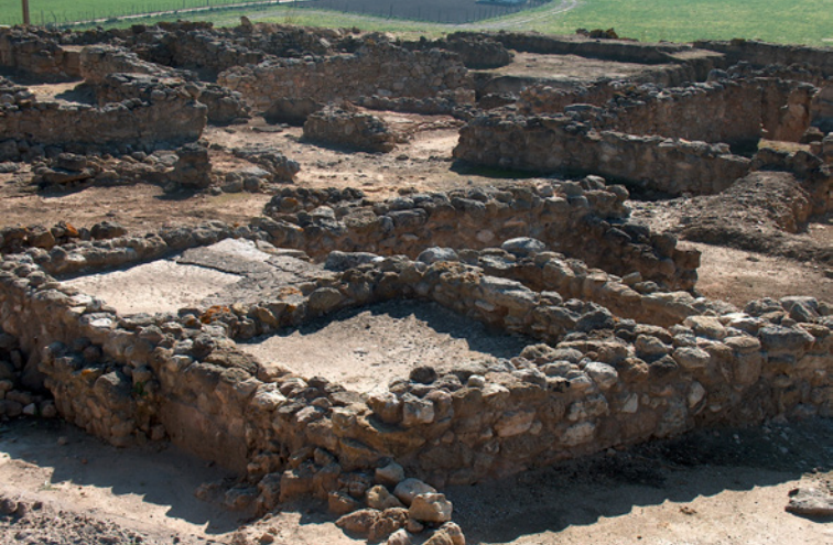
Bereich der Wohngebäude aus dem 4. und dem 3. Jh. v. Chr. Im Vordergrund die Becken zur Weinherstellung

Diese sollen Klarheit und Daten zur Interpretation und Datierung der jeweiligen Ablagerung oder dem Zeitalter, dem diese angehört, verschaffen.