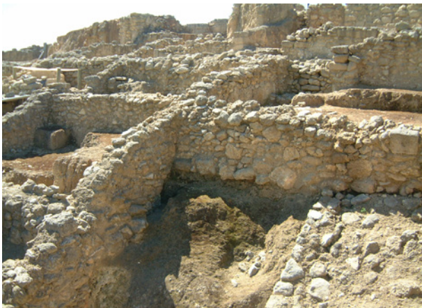
Bereich der Wohngebäude aus dem 8. Jh. v. Chr.

Die Gebäudeüberreste aus dem 8. Jh. v. Chr. befinden sich im Allgemeinen unter einer enormen Sedimentschicht, die sich in den darauf folgenden Zeiten auf ihnen abgelagert hat. Deshalb ist eine Grabung von 7 bis 9 m Tiefe erforderlich, um sie freizulegen. Trotzdem wurde ein großer Bereich außerhalb der archaischen Stadtmauern gefunden, die nachfolgend nicht von darüberliegenden Bauwerken bedeckt wurden. Dadurch konnte im Rahmen der Ausgrabungen ein weitreichender Bereich