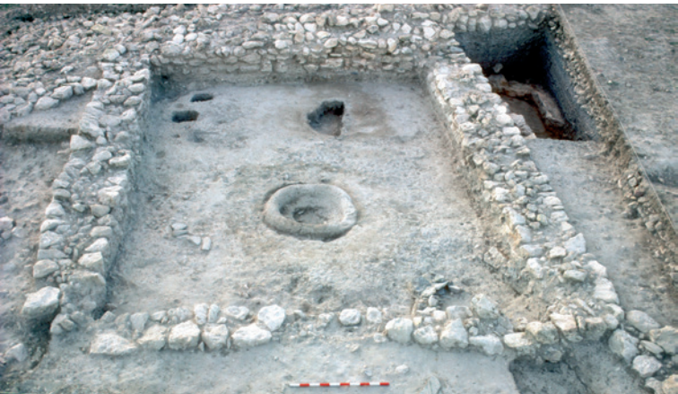
L'atelier métallurgique CE 72

Elle clôture la zone la plus interne du plateau central, considéré comme l'enceinte la plus singulière en raison des bâtiments communaux découverts à l'intérieur. Soulignons ceux rectangulaires en rapport avec le travail de la métallurgie, où il