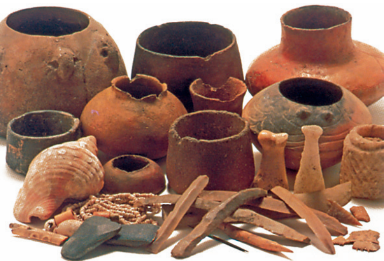
Trousseau funéraire de la tombe 40 (Musée Archéologique National)

Le statut des individus enterrés se reflète sur les trousseaux funéraires, c'est-à-dire sur les objets avec lesquels ils étaient enterrés. Soulignons les objets fabriqués à l'aide de matières premières exotiques telles que l'ivoire ou la coquille d'oeuf d'autruche, des outils en cuivre, des urnes en céramique à la décoration symbolique ou en forme de cloche et des pointes de flèche et des poignards en silex.