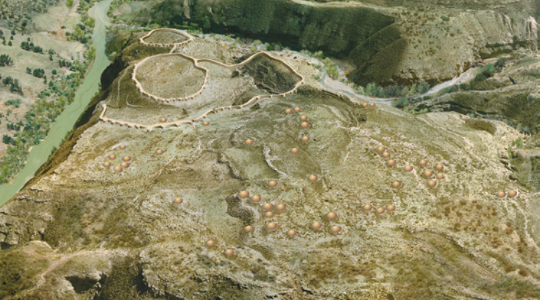
Reproduction infographique aérienne de la nécropole de Los Millares