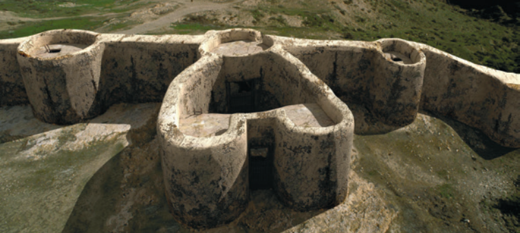
Reproduction infographique de la porte principale

Nous trouvons également ici deux tombes, antérieures à la construction de cette enceinte, qui ont été intégrées au périmètre de la muraille après sa construction.