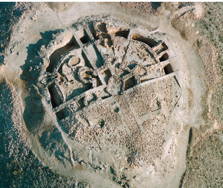
Vue aérienne du Fortin 1 en 1985

Le système défensif de Los Millares est complété par 13 fortins situés sur les collines les plus proéminentes, des deux côtés de la Rambla de Huéchar. Sa composition va des tours circulaires simples, avec une petite barbacane qui défend la porte, à des structures beaucoup plus complexes, telles que celle du Fortin 1, auquel, mise à part la fonction stratégique et militaire, il a été attribué d'autres fonctions telles que le broyage et le stockage des céréales, l'apprentissage, car c'est ici que les jeunes étaient initiés à la taille des pointes de flèches, et l'activité rituelle ou symbolique, suggérée par les nombreuses idoles anthropomorphes faits d'os et de pierre trouvés.