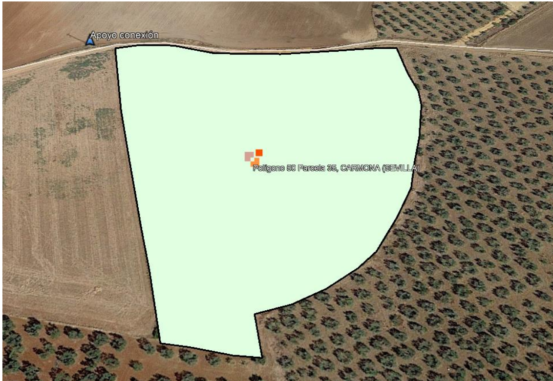
Tabla 1. Datos geográficos del lugar

El suelo en el que se encuentra ubicado el presente proyecto es rustico permitiéndose el uso para albergar actividades de venta de energía.