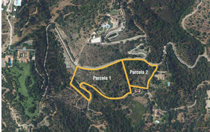
Localización de las parcelas 107 (1) y 108 (2)

Según el PGOU municipal, ambas parcelas se clasifican como Suelo No Urbanizable Simple. Tras la entrada en vigor de la Ley 7/2021, de 1 de diciembre, de impulso para la sostenibilidad del territorio de Andalucía (LISTA), ambas pasarían a ser clasificadas como Suelo Rústico.