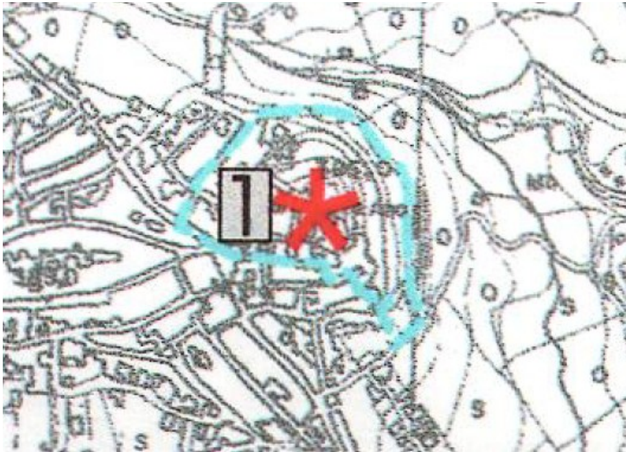
Entorno declarado del BIC “Castillo de Alozaina” Plano i.4.1 del PGOU Documento de Adaptación parcial de la LOUA

La obra se ubica en el centro histórico del municipio, dentro de los Bienes de Interés Cultural “Torre de María Sagredo” (código: 01290130001) y “Castillo de Alozaina” (código: 01290130006).