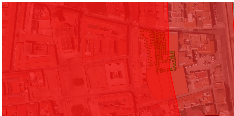
Figura n.º 2: Estudio de detalle (Parcelas Trinidad 13, 15 y 17)[en verde], dentro de las dos zonificaciones arqueológicas (Yac. n.º 33 y n.º 75)[ en rojo].”

Visto lo anterior esta Comisión adopta el siguiente: