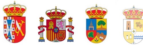
Ayuntamiento de Cortes y Graena

Seguimiento, para que en un plazo de seis meses la parte incumplidora cumpla los compromisos que se consideran incumplidos. Una vez transcurrido este plazo, y si persistiera el incumplimiento, la parte requirente notificará a los firmantes la concurrencia de la causa de resolución y se entenderá resuelto el convenio, salvo aplicación del apartado 52.3 de la Ley 40/2015 de Régimen Jurídico del Sector Público.