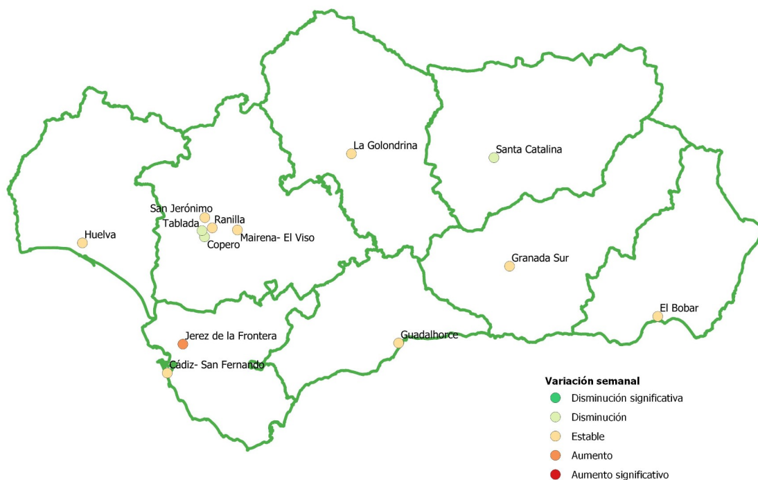
Figura 1. Representación geográfica de los datos de variación en los puntos de muestreo (QGIS 3.16).

Datos Red VATAR (V): El Bobar, Cádiz- San Fernando, Jerez de la Frontera, Granada Sur, Guadalhorce, Huelva y Santa Catalina. Datos Red RAVAR: Copero, Ranilla, San Jerónimo, Tablada y Mairena-El Viso EMASESA; Datos La Golondrina EMACSA.