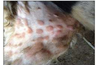
Lesiones granulares en forma de pápula