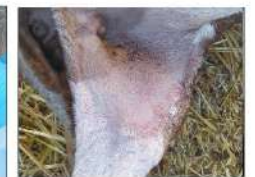
Lesiones en forma de vesículas y pápulas en la base del muslo

3 SI SE DETECTA CUALQUIERA DE ESTOS SÍNTOMAS O LESIONES COMPATIBLES CON LA ENFERMEDAD COMUNIQUE DE FORMA INMEDIATA A LOS SERVICIOS VETERINARIOS OFICIALES ESTOS HALLAZGOS Y SIGA SUS INSTRUCCIONES