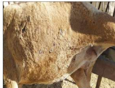
Lesiones avanzadas, en fase de cicatrización, distribuidas por todo el cuerpo y abdomen