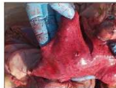
Lesiones características en órganos internos (higado, pulmón...)