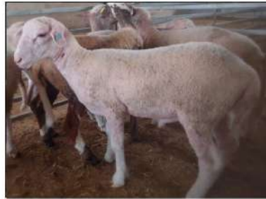
Oveja con extensas lesiones en forma de pápula (similares a granos rojos) distribuidos por todo el cuerpo, en especial en la zona del abdomen

2 Buscar cuidadosamente lesiones de estos tipos: Enrojecimiento, vesículas llenas de líquido, o bien rotas con puntos rojos de la piel, otras heridas, lesiones cicatrizadas en forma de puntos negros, llagas