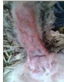
Lesiones en forma de pápulas en la base y debajo de la cola