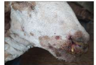
Lesiones erosionadas y en fase de cicatrización en el hocico