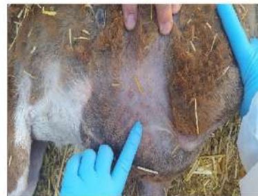
Lesiones granulares en forma de pápulas distribuidas por el abdomen y la zona inguinal