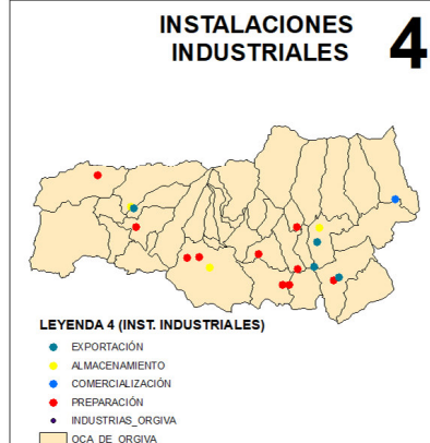
4 INSTALACIONES INDUSTRIALES LEYENDA 4 (INST. INDUSTRIALES) ● EXPORTACIÓN ● ALMACENAMIENTO ● COMERCIALIZACIÓN ● PREPARACIÓN ● INDUSTRIAS_ORGIVA ■ OCA_DE_ORGIVA