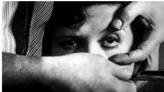
4B. Luis Buñuel, Un perro andaluz , 1929.