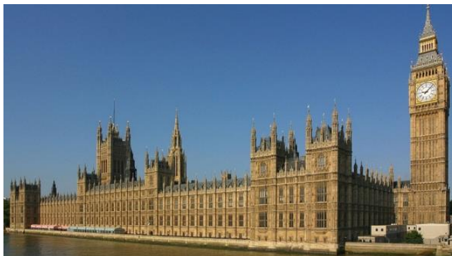
3B. Parlamento británico, 1840, London.