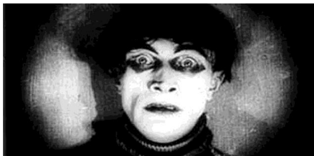
4A. Robert Wiene, El gabinete del doctor Caligari , 1920.