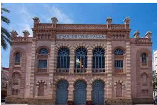
3A. Gran teatro Falla, 1884-1910, Cádiz.